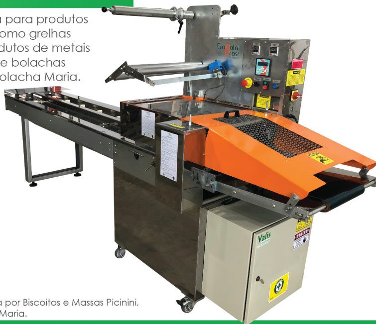
Foto: Máquina adquirida por Biscoitos e Massas Picinini, embaladora de Bolacha Maria.

Embaladora robusta para produtos grandes e sólidos. Como grelhas para banheiros, produtos de metais em geral. Pacotes de bolachas agrupados, como bolacha Maria.