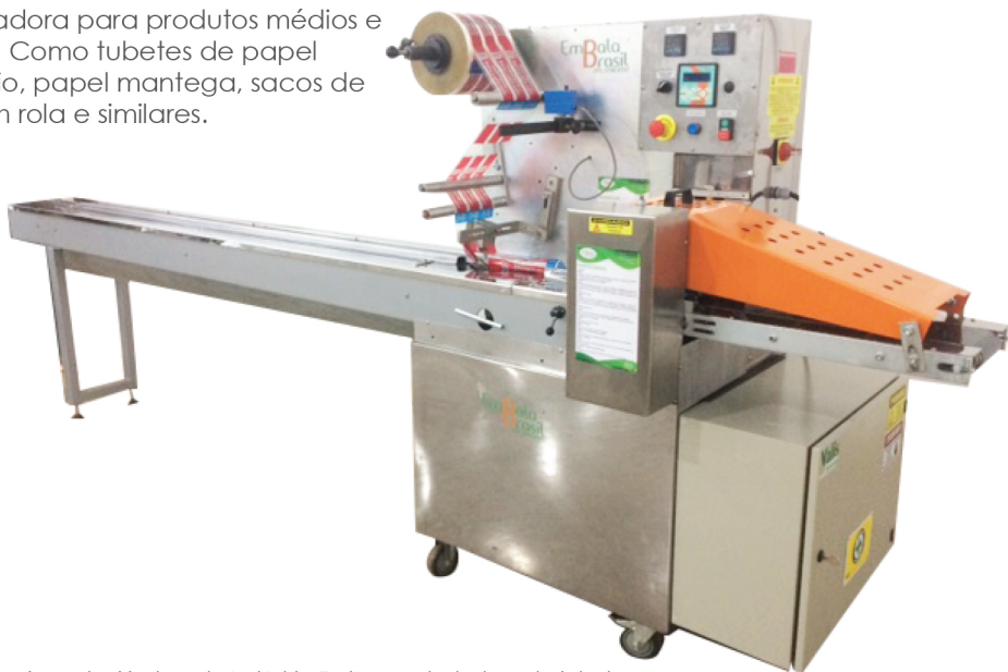
Foto: Máquina adquirida pela Indústria FortLar, embaladora de tubetes.

Embaladora para produtos médios e sólidos. Como tubetes de papel alumínio, papel manteiga, sacos de liox em rola e similares.