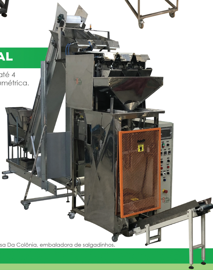
Foto: Máquina adquirida pela Casa Da Colônia, embaladora de salgadinhos.

Máquina Vertical, suporta até 4 balanças ou pesagem volumétrica.