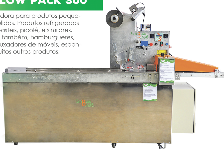
Foto: Máquina adquirida pela Indústria Kleinert Alimentos, embaladora de doces.

Embala também, hamburgueres, pães, puxadores de móveis, esponjas e muitos outros produtos.