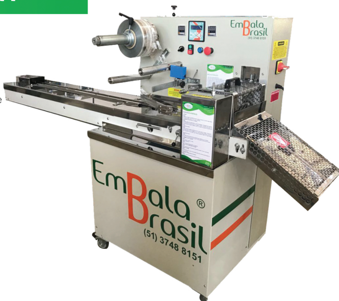
Foto: Máquina adquirida pelo Chocolates Planalto, embaladora de chocolates.