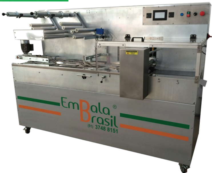
Foto: Máquina HARD, encontra-se em nosso Show Room para visitaç o.

Embaladora HARD, com abastecimento de duas bobinas de embalagens, abastecimento através de esteira automática.