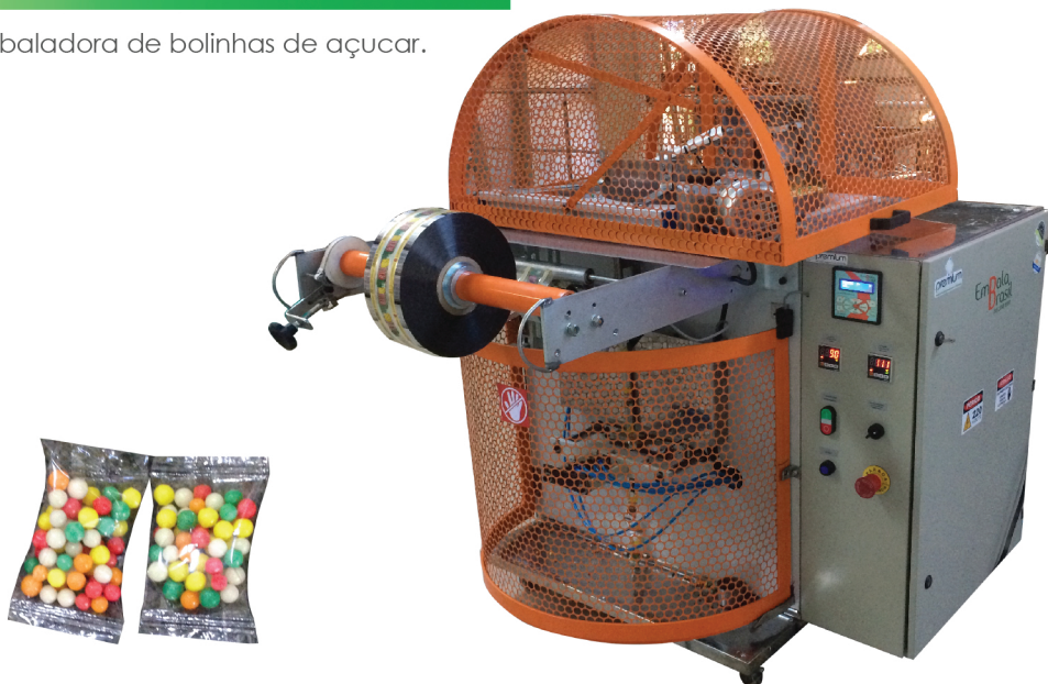
Foto: Máquina adquirida pela Angeumar Mini Brinquedos, embaladora de bolinhas de açúcar.