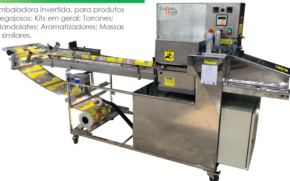
Foto: Máquina adquirida pela Indústria Massas Milano, embaladora de massas.

Embaladora invertida, para produtos pegajosos; Kits em geral; Torrones; Mandolates; Aromatizadores; Massas e similares.