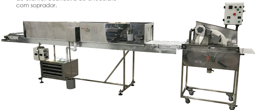
Foto: Máquina adquirida por Biscoitos ML, cobrideira de biscoitos.

Cobrideira com túnel de resfriamento, túnel com comprimento de 1 metro até 5 metros, conforme necessidade do cliente. Cobrideira de chocolate com soprador.